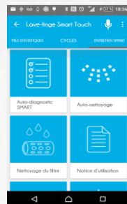
Smart Check Up